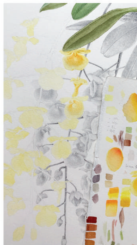
Fig. 2, 3, 4. – Étapes de la réalisation de la planche de Dendrobium aggregatum .

grain satiné - qui a la particularité d'être parfaitement lisse, ce qui permet de peindre avec davantage de précision. J'ai une passion pour les sujets de très petites dimensions qui m'offrent la possibilité d'aller aussi loin que possible dans le détail, j'utilise de minuscules pinceaux, ce qui me permet de peindre avec beaucoup de détails (figures 2 à 5). De manière générale, j'aime tenter de donner leurs lettres de noblesse à des sujets aussi triviaux qu'une grappe de groseilles, un coquillage ramassé sur la plage, une clémentine tout juste épluchée ou un bouquet de fleurs (figures 6 à 9). Je privilégie aussi l'emploi d'une palette de couleurs limitée que je mélange moi-même, afin d'obtenir toutes les nuances qui me sont nécessaires pour représenter les couleurs de la nature avec exactitude, en particulier la gamme des verts. »