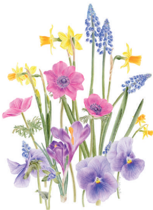
Fig. 9.– Bouquet, aquarelle.