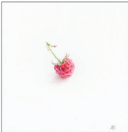
Fig. 7.– Framboise, aquarelle.