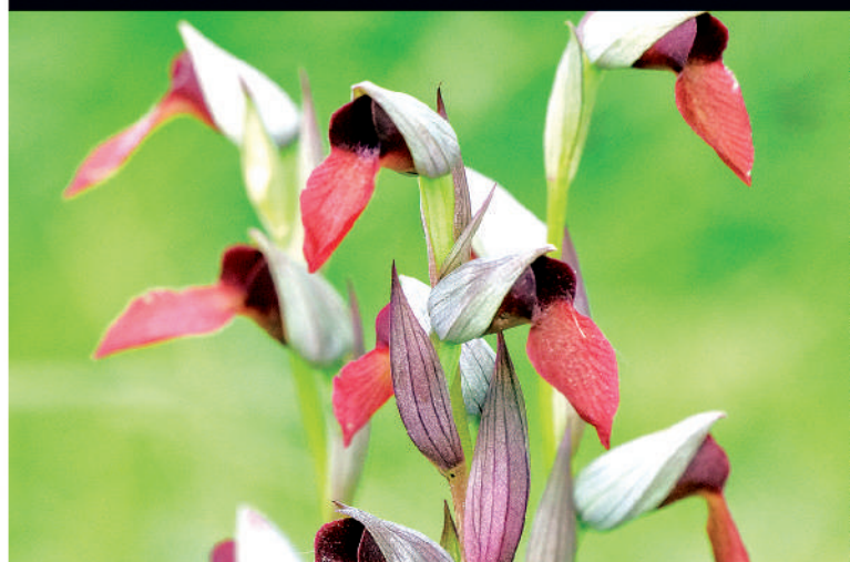
225 Les hybrides intra-génériques des Serapias