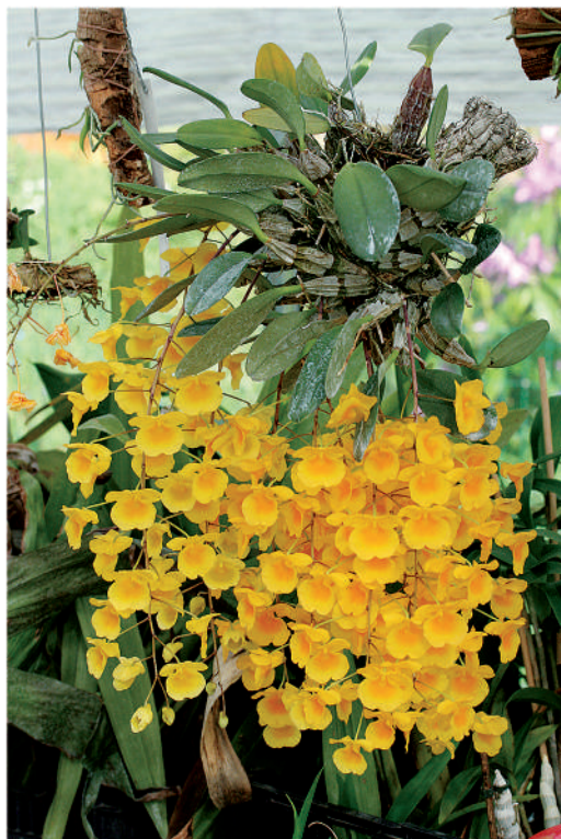
Fig. 10.– Dendrobium aggregatum.

« Je sors également la plupart de mes orchidées en extérieur en été. Seuls les Vandas (chauds) et les Phalaenopsis restent dans ma serre (tempérée) de 18 m 2 . Je ne cultive que quelques familles d'orchidées (Angraecum, Cattleya, Dendrobium, Laelia et Paphiopedilum). Je dispose d'un arrosage automatique par électrovanne lors de mes absences. Mais je préfère un arrosage manuel, cela me permet de « surveiller » mes protégées et de réagir rapidement à toutes sortes de problèmes ». ●