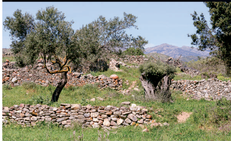
197 De Thésée à Dionysos en suivant Ariane à Naxos