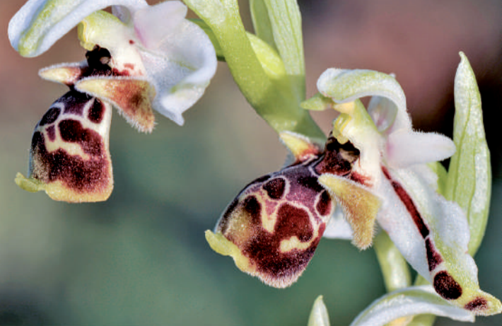
205 Découvertes en Albanie et le sud de la Grèce