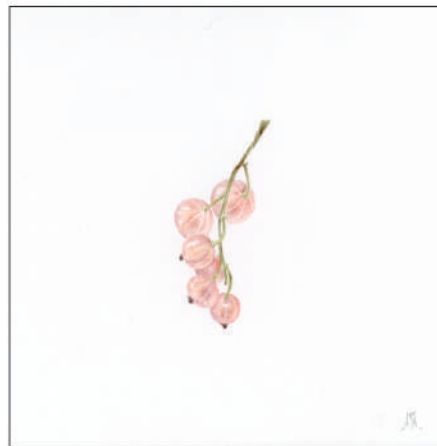
Fig. 8.– Groseille, aquarelle.