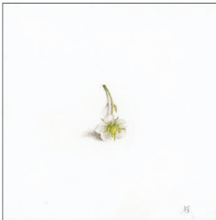
Fig. 6.– Fleur de fraiser, aquarelle.